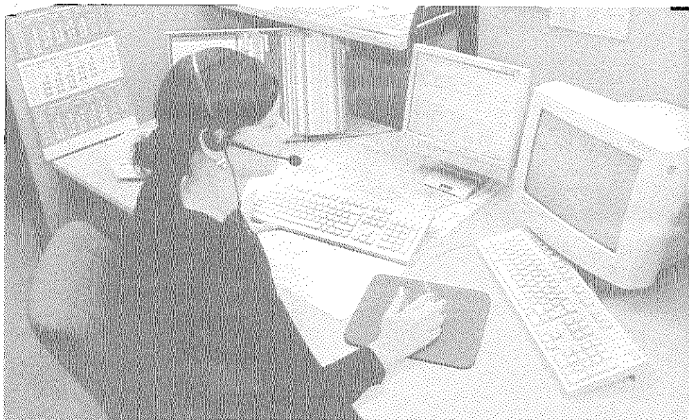
Gute elektronisch/telefonische Erreichbarkeit eines Unternehmens ist ein Stück Visitenkarte des Hauses.